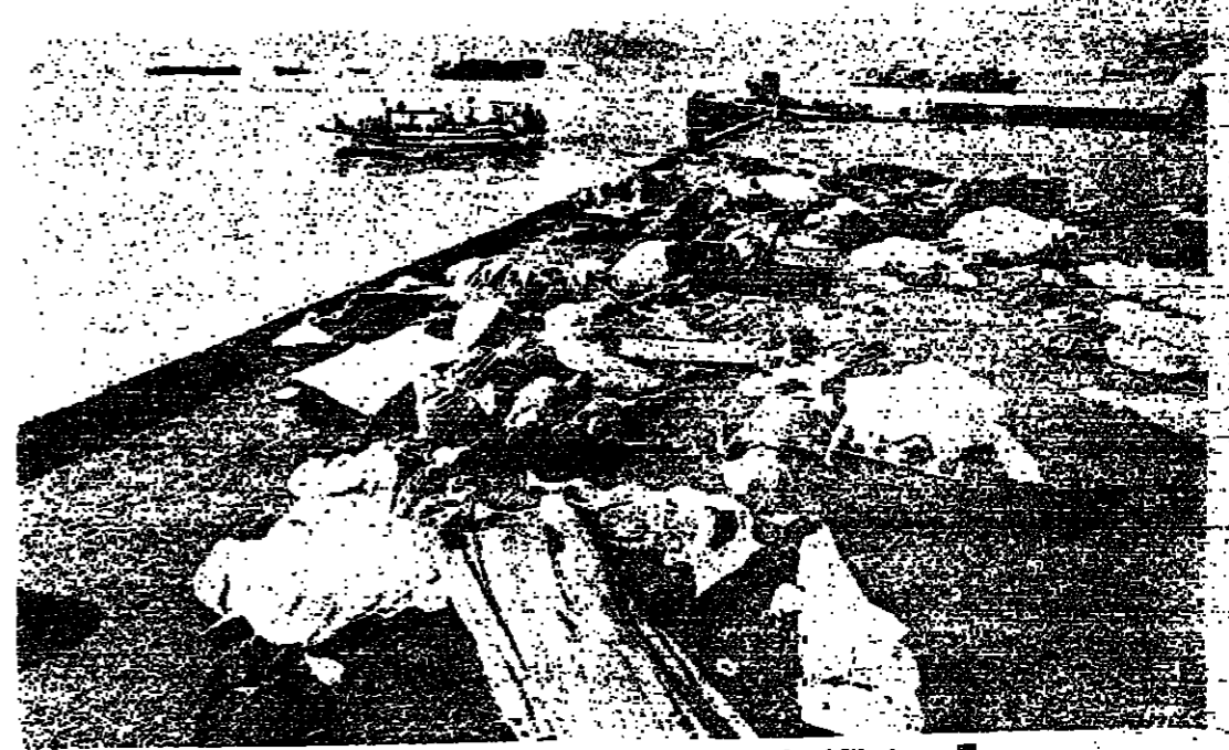
جثث القتلى في مدينة (هانانغ) الفيتنامية

تصفت القوات الشيوعية أمس بخطة كسوان لوك الرئيسية ، كما هاجمت قوات المداة الحكومية بقوات دفاعها الدبابات في شمال المدينة ، بينما تستمر عمليات القصف على الخطوط الدفاعية خارج سيلفون . وقالت القيادة العسكرية في سيلفون ان الهجمات الشيوعية اطلقت عدة قذائف من عيار 100 ملمبر على المدينة بعد منتصف الليل . ولم تشر القذائف الى اية اصابات . ويعد ساعات قليلة قامت القوات الشيوعية بتدمير الدبابات الهجوم على المواقع الحكومية شمال كسوان لوك المنتشرة حول الطريق رقم واحد الذي يبعد 72 كيلو مترا الى الشمال من سيلفون . واضحت المصادر الحكومية قول انه لم تكون ارقام عن الاصابات . لكن هذه المصادر زعمت ان القوات الحكومية قتلت 236 جنديا شيوعيا في الاشتباكات التي جرت أمس الاول كما استردت ثلاثة جثث وأسوات على 62 قطعة من الأسلحة المختلفة بينما تكتبت 22 قبلا قسط و 79 جرحا . وقالت المصادر العسكرية الحكومية ان القوات الأولى انها اصابت سيطرتها الكتيبة على كسوان لوك التي دخلها الشيوعيون مرتين في اربعة ايام من القتال الضاري . الجيش يتولى السلطة بكمبوديا وفي بانكوك ، أعلن لونغ بورت رئيس وزراء كمبوديا في اذاعة له أمس الاول ان الجيش سيتولى السلطة في فيتنامية مدة ثلاثة اشهر بعد ان غادر الرئيس بالوكالة سوخام خوي البلاد . وقال ان القوات المسلحة ستقيم « لجنة عليا مؤقتة لجمهورية خيم » . وقالت اخر التقارير من العاصمة الكمبودية صباح أمس ان الهبوط الكمبودي سيبدأ على فصول ثوار مستتب ولا يوجد دليل على دخول ثوار